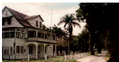
Voormalige officierswoning bij het Fort Nieuw Amsterdam Suriname

De leesbaarheid van de beschikbare documenten is onvoldoende om met succes optical character recognition (OCR) toe te passen. Daarom is gekozen voor het handmatig intypen van de gegevens in een EXCEL rekenblad.