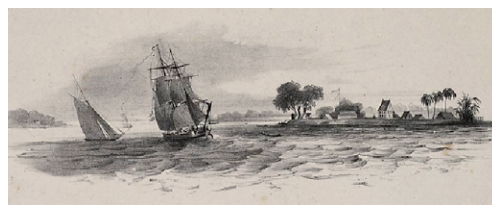
Fort Nieuw Amsterdam aan de samenvloeiing van Suriname- en Commewijnrivier

Nederland heeft een rijk koloniaal verleden. Om de Nederlandse belangen in de overzeese gebieden te beschermen, waren op veel plaatsen legeronderdelen aanwezig. De vele Nederlandse forten die in de Afrikaanse en Aziatische kustgebieden terug zijn te vinden getuigen daar van. Ook in Suriname en op de Nederlandse Antillen zijn forten terug te vinden. Deze doen nu vaak dienst als museum of maken deel uit van regeringsgebouwen, zoals op Curaçao.