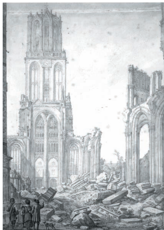
Figuur 2. Gezicht op de ruïne van het schip van de Domkerk te Utrecht uit het oosten: het schip, met op de achtergrond de westgevel, en de Domtoren. (H. Saffleven)

of vernield. De hoge spits op de toren van de St. Jacobskerk, nu Jacobikerk, wordt ook verwoest tijdens deze storm en is toen vervangen door een gewoon dak (figuur 1). De St Nicolaaskerk, nu Nicolaïkerk, heeft twee torens, waarvan één tijdens de storm zijn spits verliest, die later vervangen is door een plat dak. De St. Mariakerk op de Mariaplaats (nu verdwenen) lijdt ook aanmerkelijke schade door de storm. Ook de torens van de Buurkerk, de Pieterskerk en de Agnietenkerk moeten het ontgelden. De Domkerk heeft wellicht het meest te lijden gehad onder de storm. Hoewel de kerk meerdere malen door storm schade opliep, stort deze keer het middenschip van de kerk, tussen de toren en het kruiswerk, in (figuur 2). Het middenschip van de kerk was kwetsbaar omdat het onvoldoende van steunberen voorzien was. Figuur 3 geeft een indruk van de skyline van Utrecht rond 1674, en maakt duidelijk dat de storm vrij spel had in het open landschap.