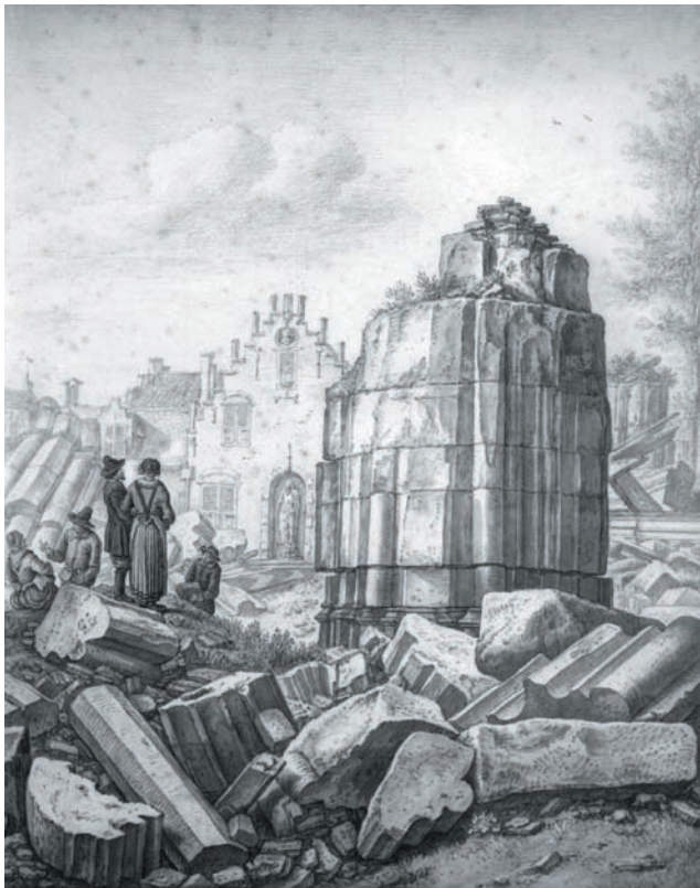
Figuur 5. Gezicht op de ruïne van het schip van de Domkerk te Utrecht uit het zuiden: de, volgens de beschrijving, door het stormgeweld ondersteboven gedraaide vierde pijler aan de zuidkant van de middenbeuk van het schip, met op de achtergrond de voorgevels van de huizen aan de noordzijde van het Domplein. (H. Saftleven)

van het front van circa 70 km/h; een snelheid karakteristiek voor dit fenomeen in Nederland. De tijdsduiding van deze bronnen is alleen consistent als het deel van het front dat zich over Utrecht bewoog versnelde was ten opzichte van het deel dat over Zuid- en Noord-Holland trok. De vervorming van het front geeft de karakteristieke boogstructuur van het front. De snelheden van dit versnelde deel van het front kunnen oplopen tot 80-85 km/h. Deze mesoschaalstructuur wordt 'boogecho' genoemd, naar de boogvorm van de echo op het radarbeeld. De hoge snelheid duidt ook op een forse verticale snelheidsschering; een noodzakelijke voorwaarde voor sterke ontwikkeling van een boogecho.