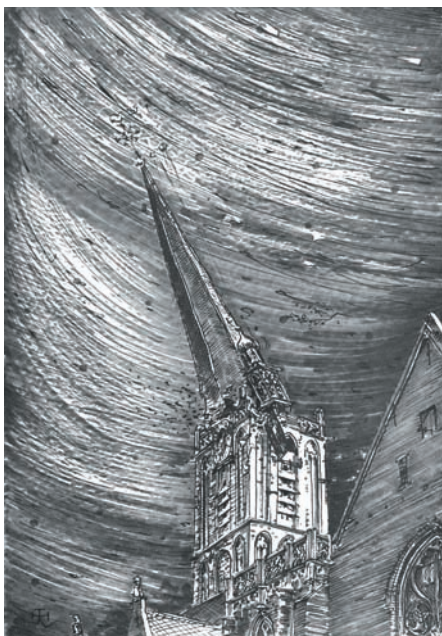
Figuur 1. De hoge naaldspits van de Jacobitoren en de uitgebouwde carillontoren storten neer. (Getekend door Th. Haakma Wagenaar, in opdracht van Restauratiecommissie 'Vijf Middeleeuwse Kerken', Utrecht.)

Op woensdag 1 augustus trekt een koufront over de lage landen die de drukende hitte van die dag verdringt door koel zomerweer. De onweerscomplexen die hiermee gepaard gaan zijn echter bijzonder actief. De wind wakkert sterk aan en samen met sterke rukwinden geeft dat aanleiding tot aanzienlijke schade op