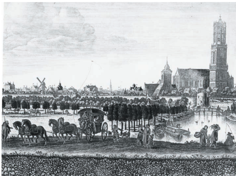
Figuur 3. Profiel van de stad Utrecht uit het westen gezien: het gedeelte met de Pieterskerk, de Buurkerk en de Domkerk en op de voorgrond de Kruisvaart. (Schijnt bijgewerkt te zijn na de 1674 tornado). (H. Saftleven, met toestemming van het Utrechts Gemeentearchief)

Naast de onwaarschijnlijk sterke rukwinden en de plaatselijk extreem sterke liftkracht van deze storm zijn er nog andere interessante aspecten van het schrickelike tempeest ; stortregens en hagelstenen. Kooch meldt 'den regen was ook over groot - glijck of het haest met emmers