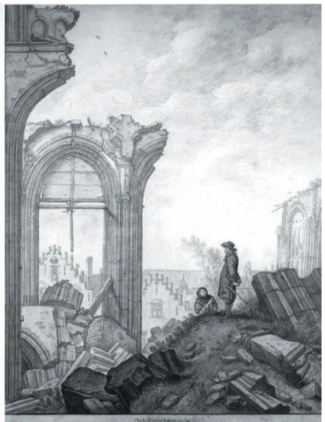
Figuur 6. Gezicht op de ruïne van het schip van de Domkerk te Utrecht uit het zuiden: de laatste scheiboog aan de noordzijde van de middenbeuk, boogrestanten van de noordzijbeuk en op de achtergrond gedeelten van de voorgevels van de huizen aan de noordzijde van het Domplein. (H. Saftleven)

Interessant aan deze verklaring is dat de trekrichting vanaf de Zuiderzee van ZO naar NW zou zijn. Waarschijnlijk heeft de getuige hier de trekrichting van de onderste wolkenlaag geobserveerd en deze gelijk gesteld aan de trekrichting