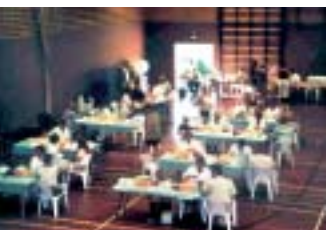
Grootschalige inzameling door het CLB. Binnenkort worden de afnames voortgezet door Sanquin Bloedbank

Tijdens de laatste afname-avond van het CLB zijn er mensen van Sanquin Bloedbank aanwezig om kennis te maken met de donors. Zij beantwoorden vragen en hebben informatiemateriaal bij zich. We hopen dat de donors zich snel zullen thuisvoelen bij onze bloedbank!